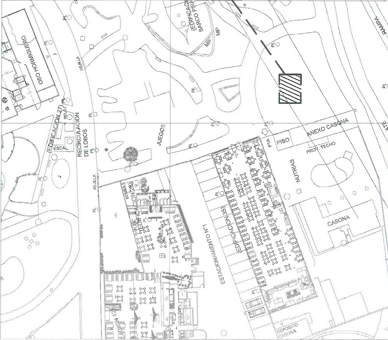
PLANO DE UBICACION